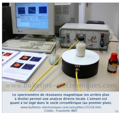
Le spectromètre de résonance magnétique (en arrière plan à droite) permet une analyse directe locale. L'aimant est quant à lui logé dans le socle circulaire (au premier plan). www.bulletins-electroniques.com/actualites/55316.htm Credits : Fraunhofer IBMT

Le groupe de chercheurs « Résonance magnétique » de l'Institut Fraunhofer des techniques biomédicales (IBMT) de Saint Ingbert, en coopération avec l'entreprise néerlandaise Magritek, a réussi à développer un spectromètre de résonance magnétique (RMN) transportable, peu encombrant et dont le prix reste abordable.